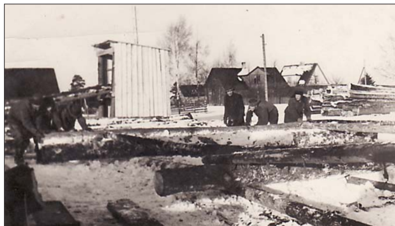
Kilingi-Nõmme Rajooni Tarbijate Kooperatiivi saeveski Kitsa tänava tistleri taga Eha ja Koidu tänava vahel.

7. septembril oli linna komnoorte klubi puhkeõhtu, mis toimus klubi ruumides Pärnu tn 18. Kuulati loengut ebausul teemal, kõneleja oli Tallinnast. Lõpuks tants. Septembri algul toimunud