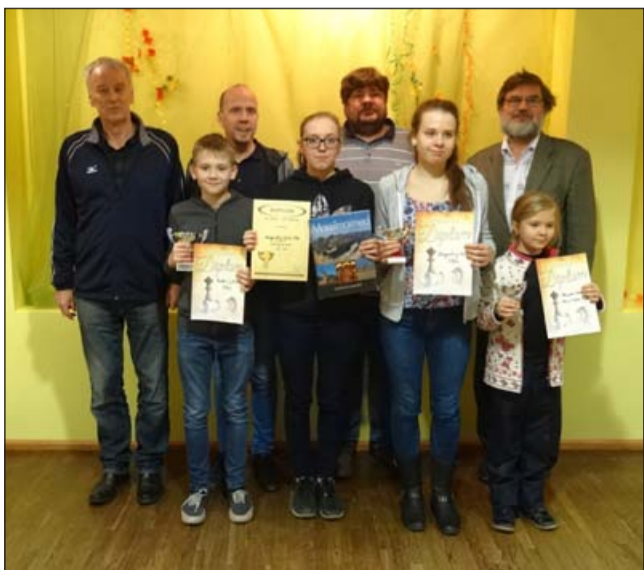
Isadepäeva maleturniiri võitjad