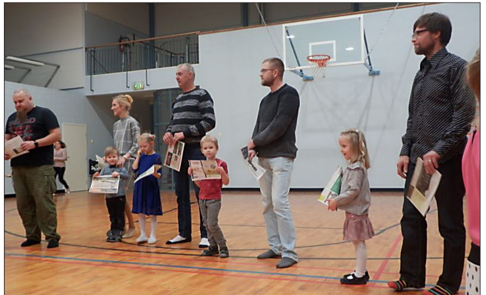
Isadepäev Surju Lasteaias