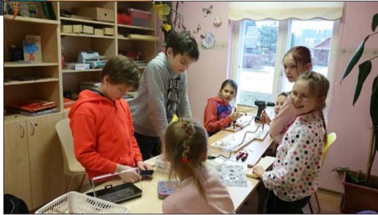
Kilingi-Nõmme Gümnaasiumi 3a klass vabaajakeskuses.

26. oktoobril toimus Sauga Avatud Noortekeskuses Pärnumaa noortekeskuste kokkutulek, kus noored said osa huvitavatest tege-