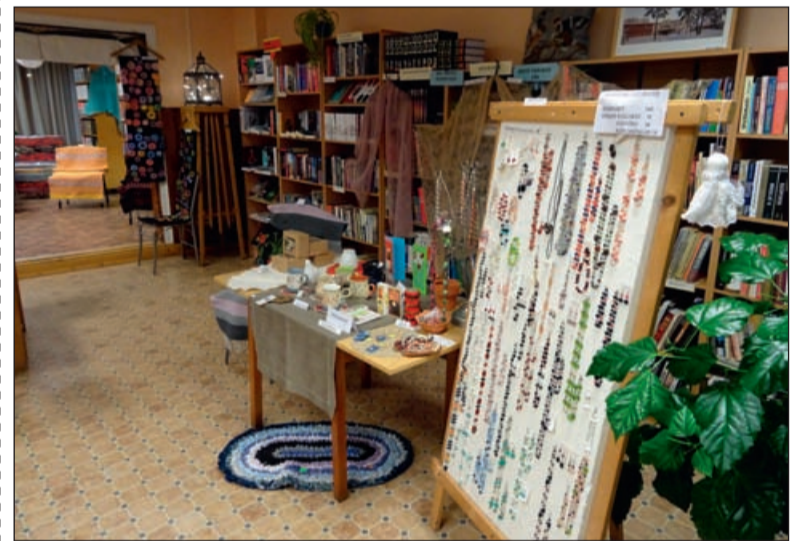
2017. aasta käsitöö näitus-müük Surju Raamatukogus