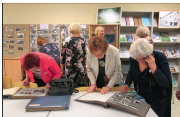
Vilistlased muuseumiklassis.

72. lend lõpetab gümnaasiumi kahe aasta pärast. Praegu tutvustavad nad näitusega vanu esemeid ja oma perede lugusid. Näituse eestvedajad on õpetajad Helle