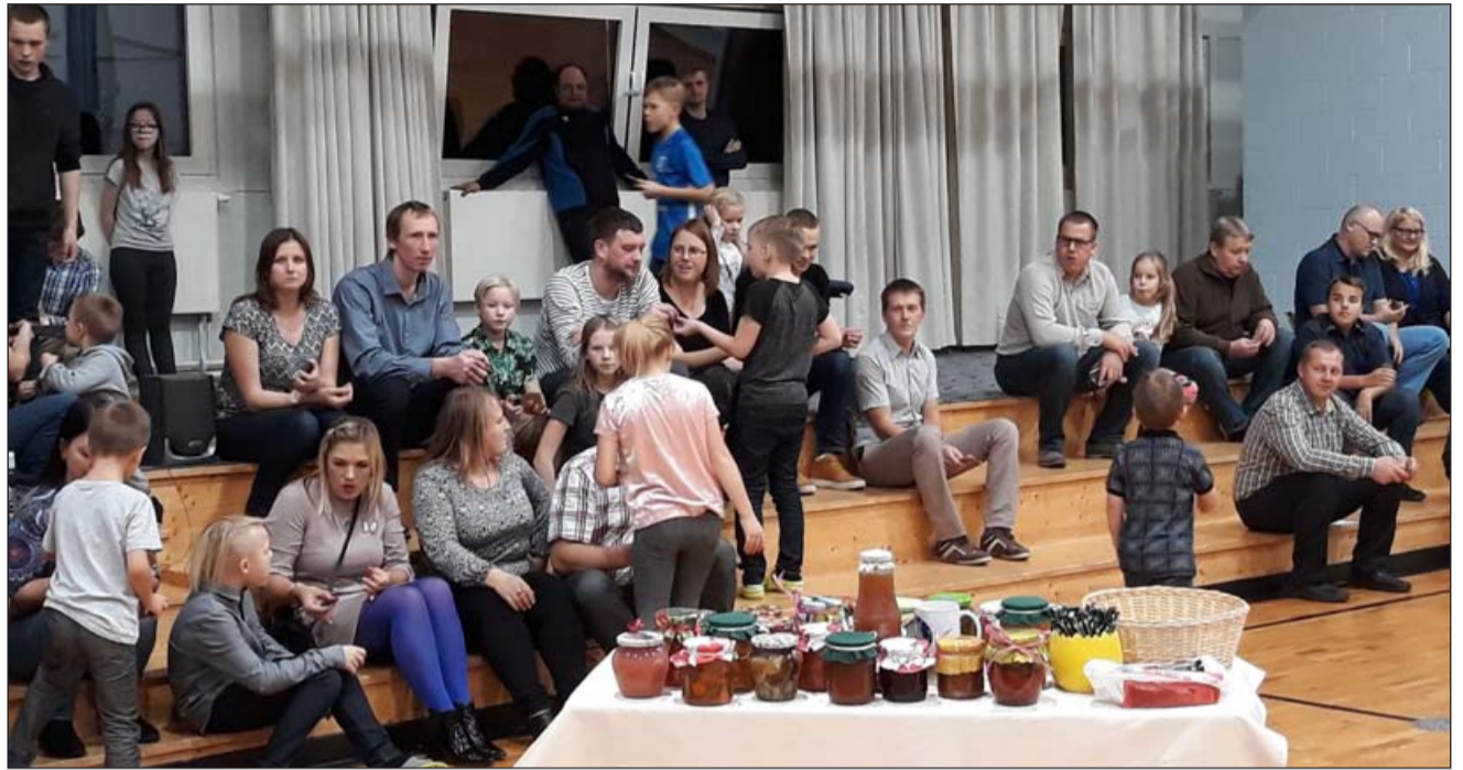
Isadepäev Surju Põhikoolis