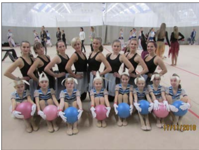
Githa vilistlasrühm ja Pääkesejätkud GymnaFestil.

Nagu ikka, kujunesid eelvoorud, Lõuna-Eesti rühmadele Viljandis ja Põhja-Eesti võimlejad Tallinnas, küllalt osavõturohkeks. Viljandis jälgis žürii 30, Tallinnas 36 rühma etteastet erinevates vanusgruppides. Suurenenud oli osavõtjate rühmade arv eelkõige vanusegrupis 30+, kus sel aastal konkureeris 5 rühma läinudaastase 2 asemel. Githa vilistlasrühm esitas vastvalminud tempoka ja head füüsilist vormi näitava kava „Ootus“, mille autoriks on Sairi Sutt.