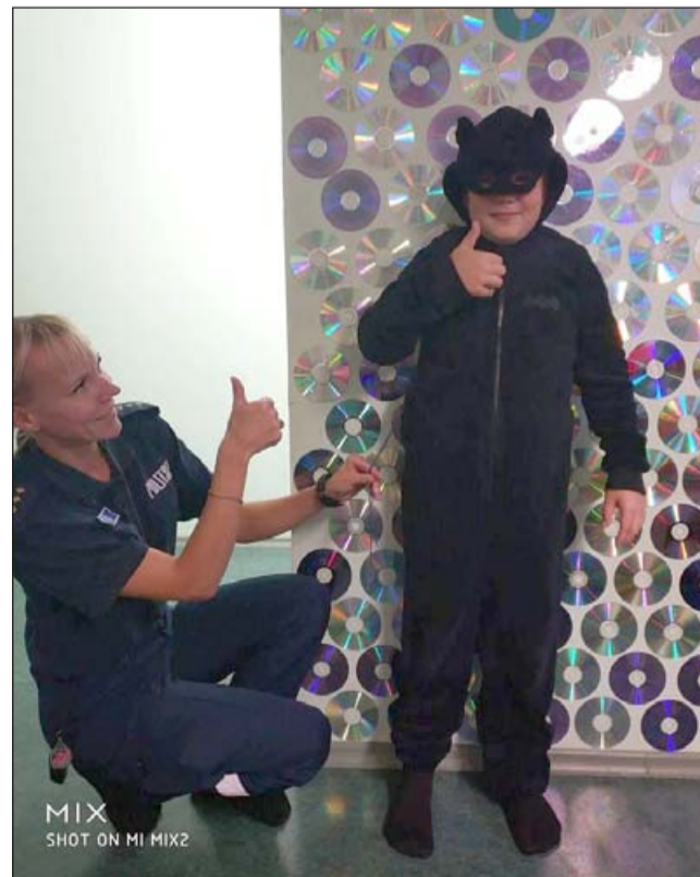
Tahkuranna Avatud Noortekeskuse superkangelane.

koos, kui pakkuda piisavalt kellelta poleks nii toredad