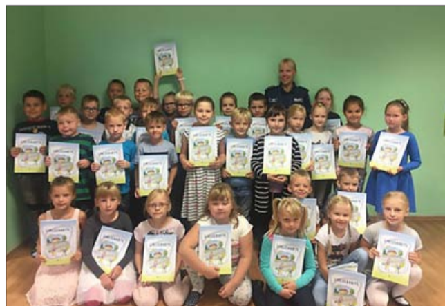
Kilingi-Nõmme Gümnaasiumi esimesed klassid.

avastamine juba varasemast teadmisi täiustada ja olla ka