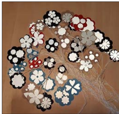
Vabaajakeskuse valmistatud helkurid.

Vabaajakeskuse helkuri tegevuse töötubades osalesid Kilingi-