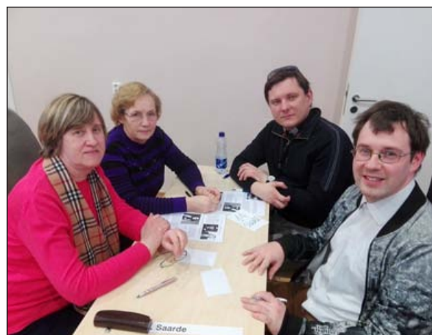
Saarde mälumänguvõistkond Eesti Maakilb