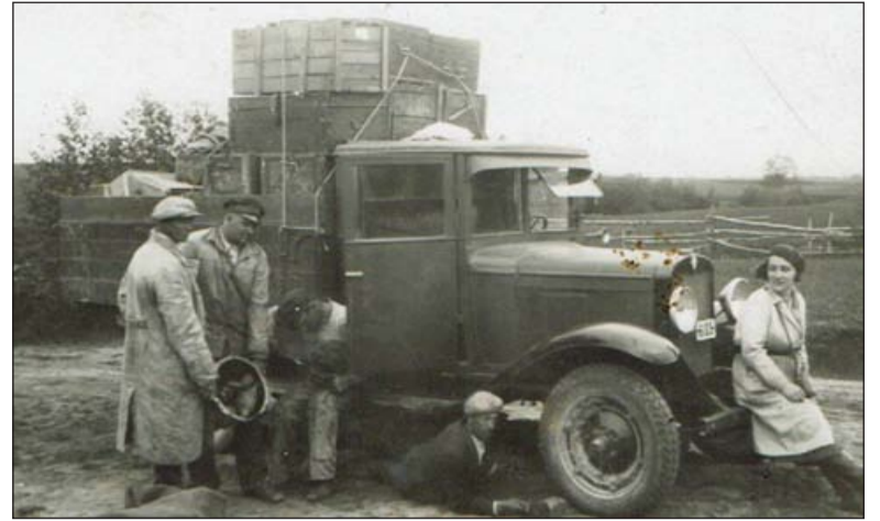
Autojuht ja transamehed teepeal kaubaveo autol käigukasti remontimas.