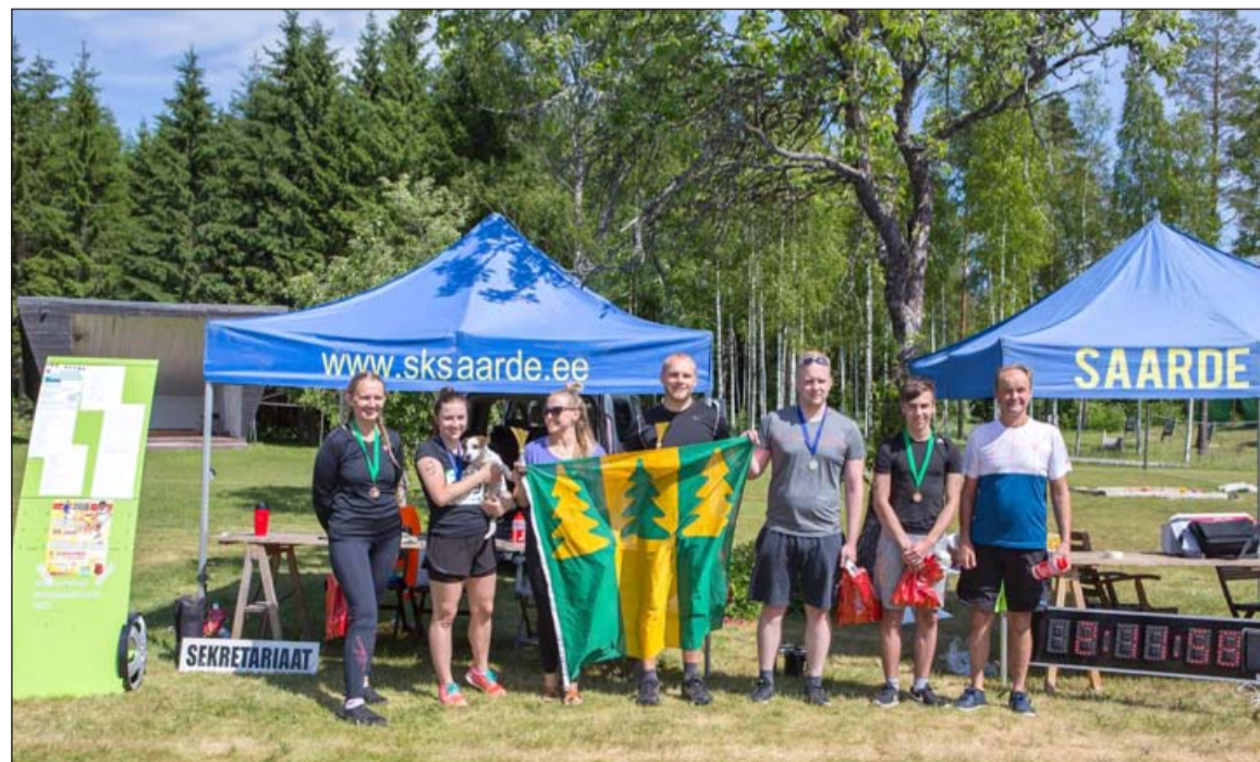
Kõveri Triatlioni võitjate autasustamine