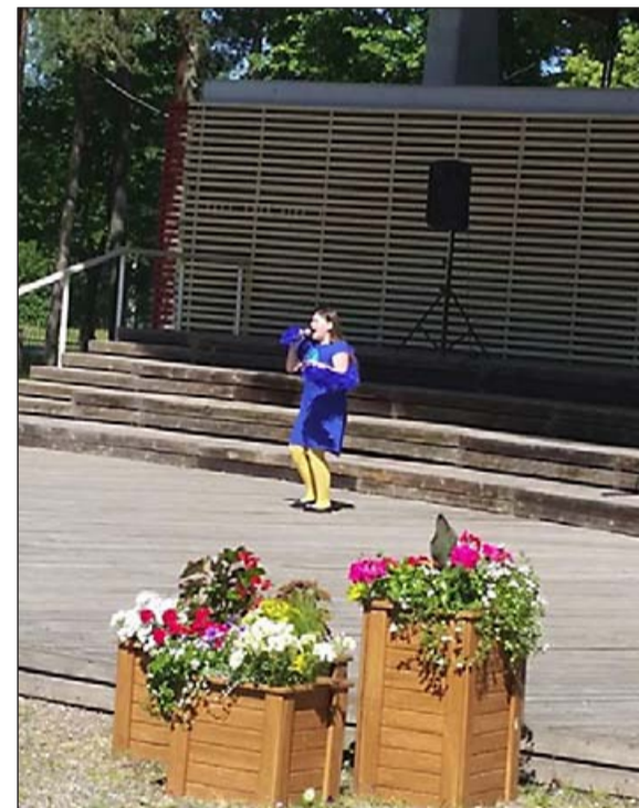
Lastekaitsepäeval Kilingi-Nõmme suveaias festivalilaulu esitamas.