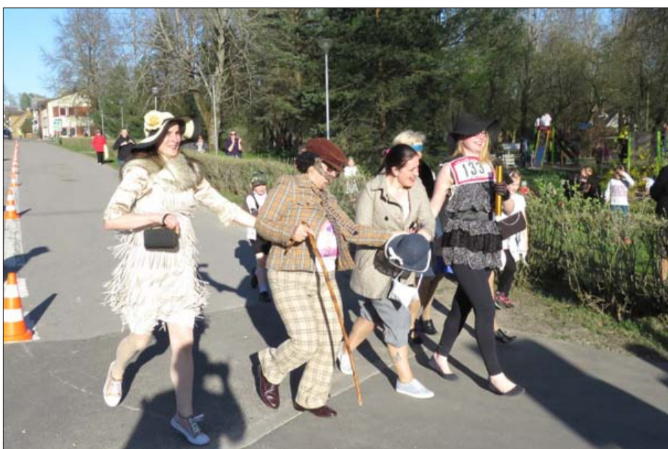
Võistkond Haaberukk ja daamid