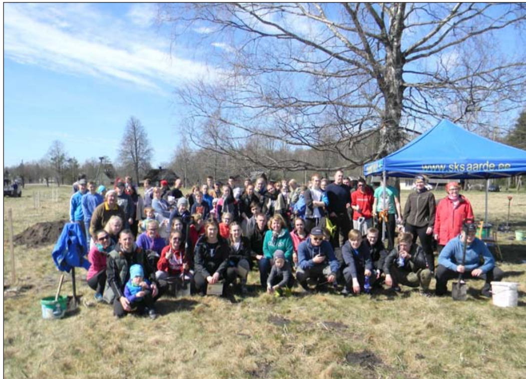
Talgupäev 6. mai 2017

2. juunil 2014 pärast emakeele lõpuksamit ja enne Eesti lipu päeva käis Kilingi-Nõmme Gümnaasiumi 9. klasside esindus Maranal oma tammetõrusid vaatamas. AS Metsataim oli tõrude eest hästi hoolitsenud ning mullast paistsid juba esimesed väikesed tammed.