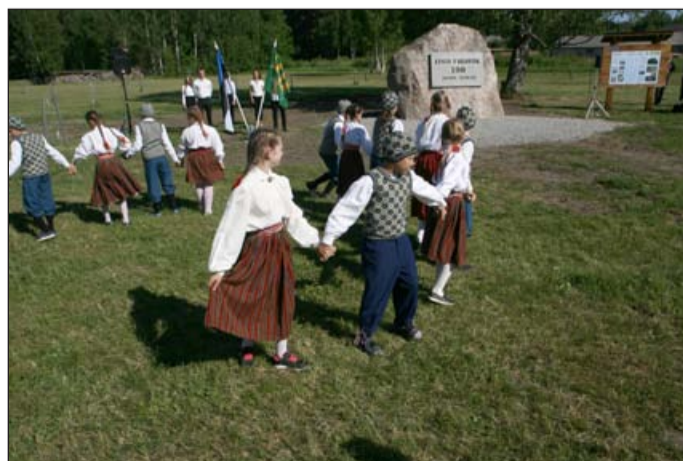
Tammesalu avamine 1. juunil