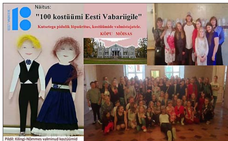
Pildid: Kilingi-Nõmmes valminud kostüümid