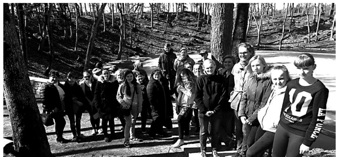
Saarde noored tutvumas Kaali meteoriidikraatriga ja selle tekkelooga.