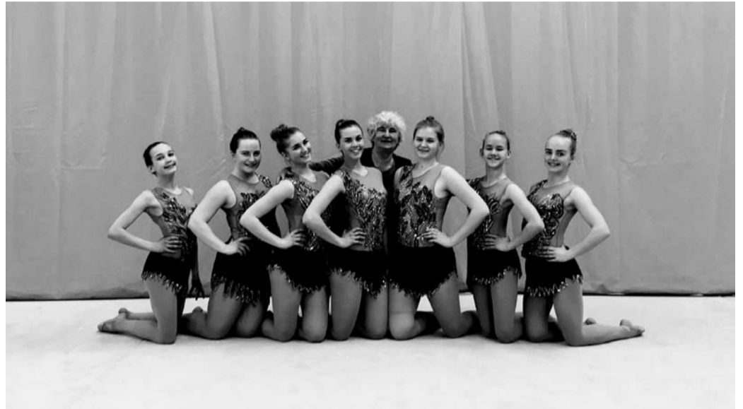
Infinitum – KRE Kuldplaat 2018 omanik!