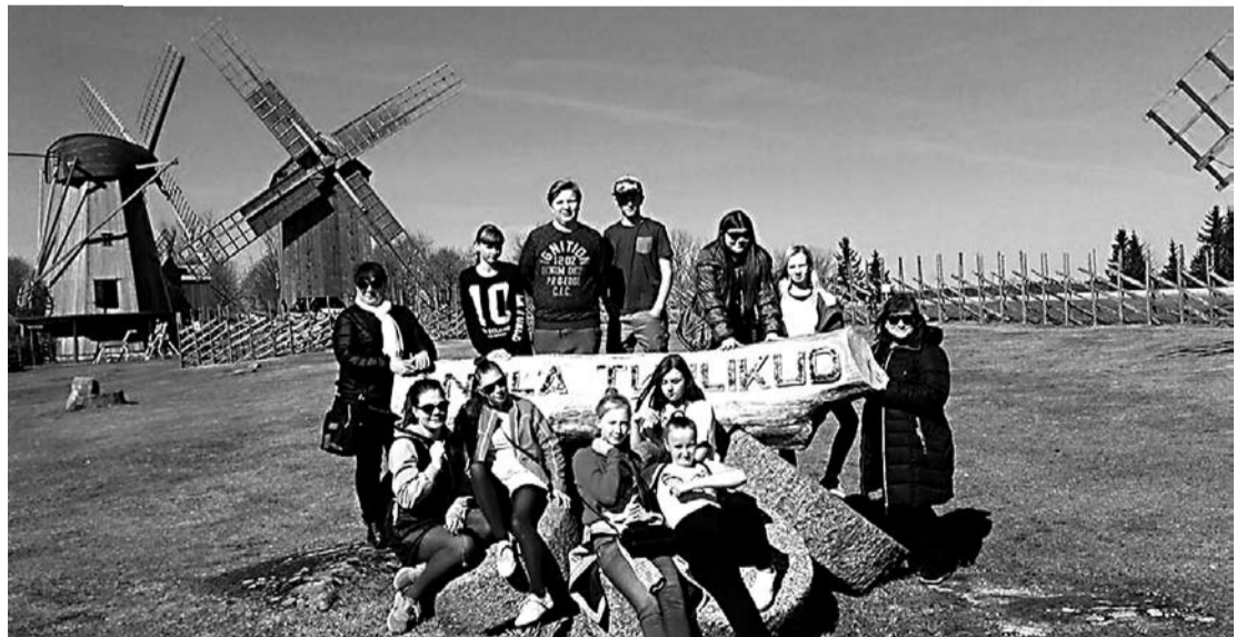
Saarde, Mõisaküla ja Abja noored Angla tuulikute ees poseerimas.