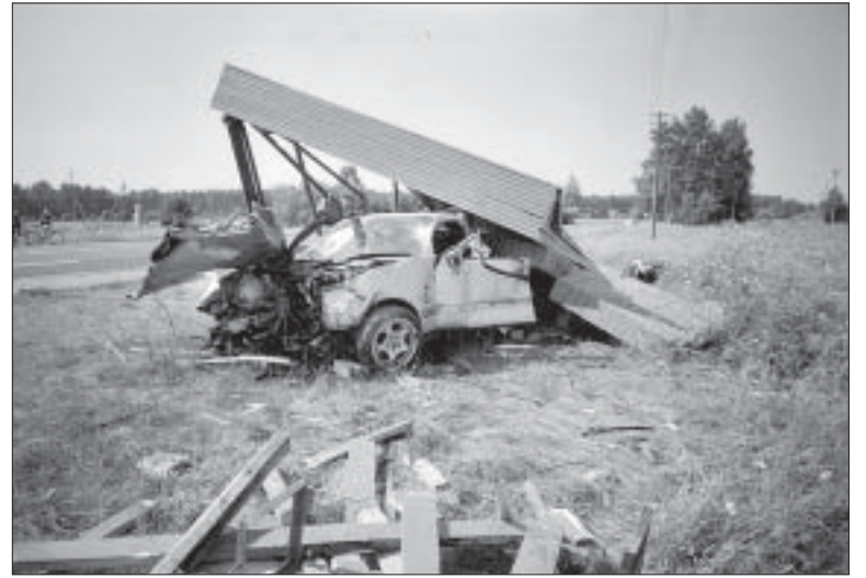
Autoavarii Surju bussiootepaviljonis.

Detsember oli meile jälle tõine. Et pidas sooja ilma, siis õnnestus ära vahetada torni laudis, tööd finantseeris sise-ministeerium. Detsembri lõpul toimus teenistuses üldine teadmiste kontroll.