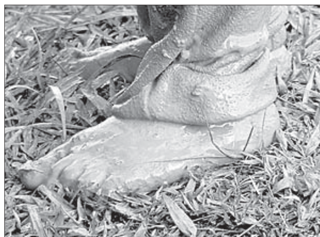
Inimeste liikumine on kaitsealadel piiratud ajal ja kohtades, kus see võib häirida kaitsealal esinevaid kaitsealuseid liike.

Keskonnaministeeriumi avalike suhete spetsialist