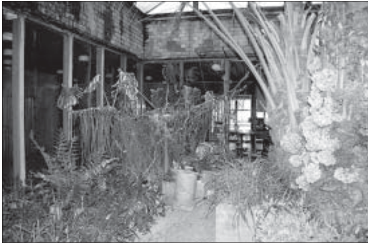
Ruumi seintest õhkub rõskust, see näib sobivat südikatele sõnajalapoegadele, kes seinakivide vahele kannu on kinnitanud.

Seni on taimed vastu pidanud. Palmilehed on vastu külma klaaslage, ruumi seintest õhkub rõskust, see näib sobivat südikatele sõnajalapoegadele, kes seinakivide vahele kannu on kinnitanud. Kaktused ja paksulehised potitaimed ning lihtsamad pinnakat-